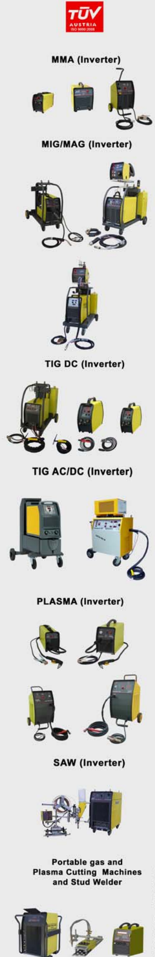
Portable gas and Plasma Cutting Machines and Stud Welder