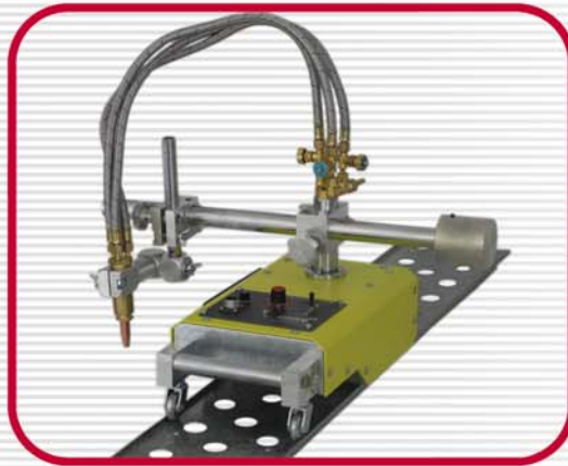
Gas Cutting Machine (G1)