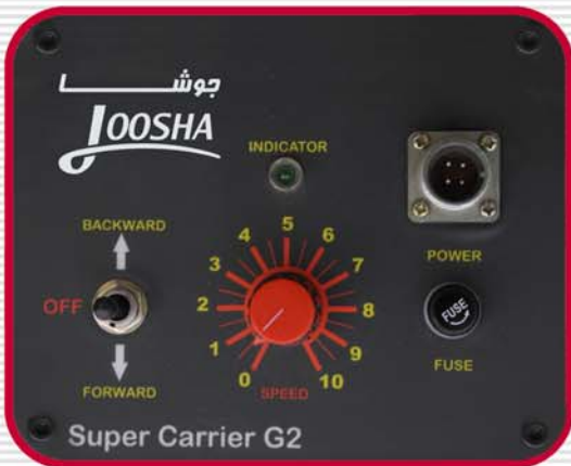
Super Carrier G2