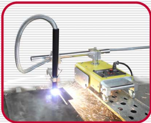
Plasma Cutting Machine (P1)

All clamps have a very robust and reliable construction and